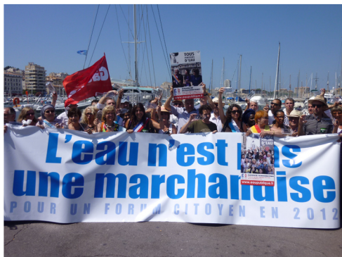
Manifestation « Porteurs d'Eau » (citoyen-n-es, syndicats, associations, collectifs, élu-e-s Europe Ecologie, les Verts, Poc, Front de Gauche, PS) sur le Vieux-Port à Marseille, 7 juillet 2010.